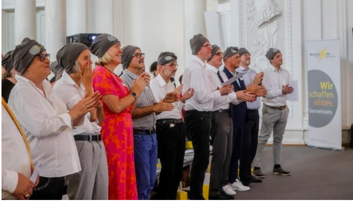
Unser Jubiläums – Song: Ein voller Erfolg!