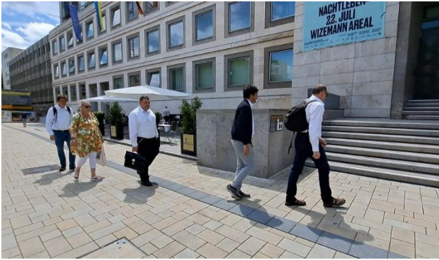
Der Vorstand auf dem Weg ins Rathaus.

Wir haben uns gefragt: Wird unsere Idee funktionieren?